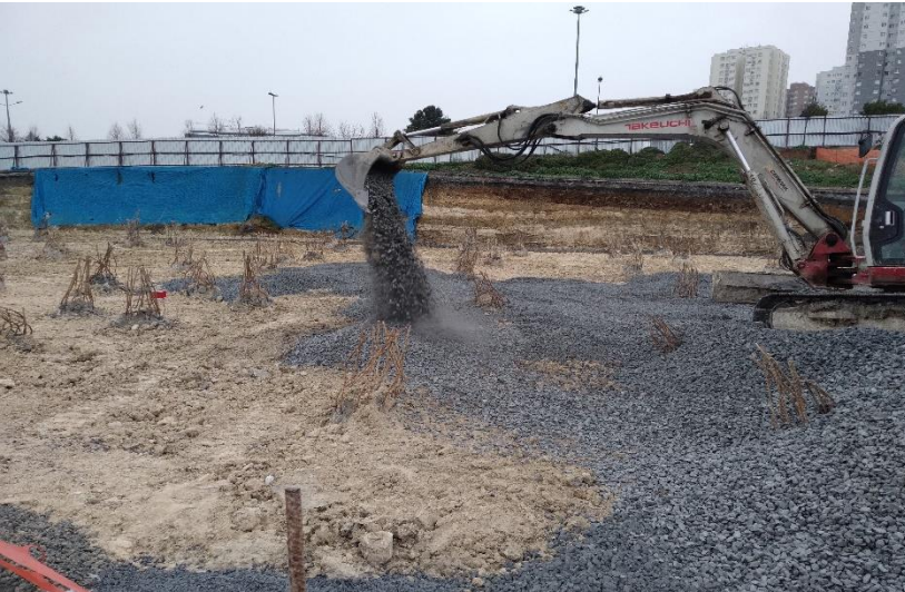
Aralık ayı genel durum -2