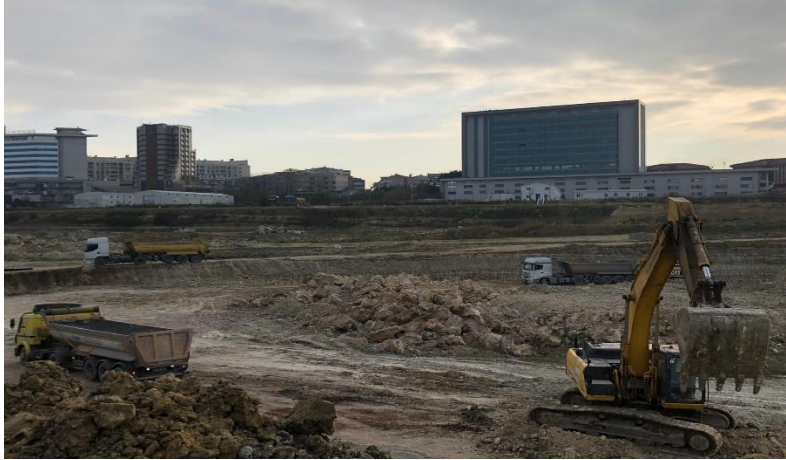
Aralık ayı genel durum