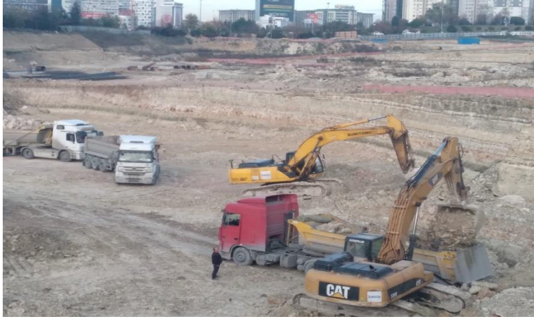
Kasım ayı genel durum