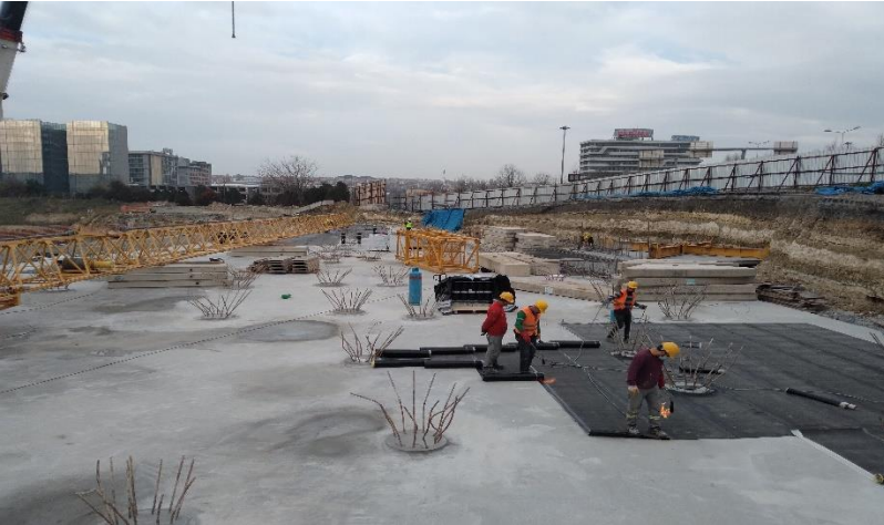
Ocak ayı temel altı izolasyon