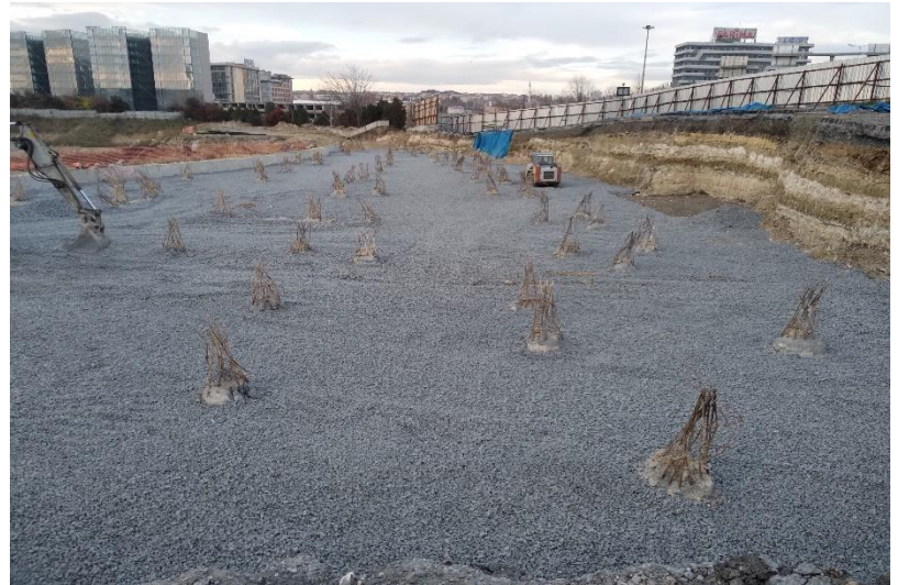
Aralık ayı genel durum – 3