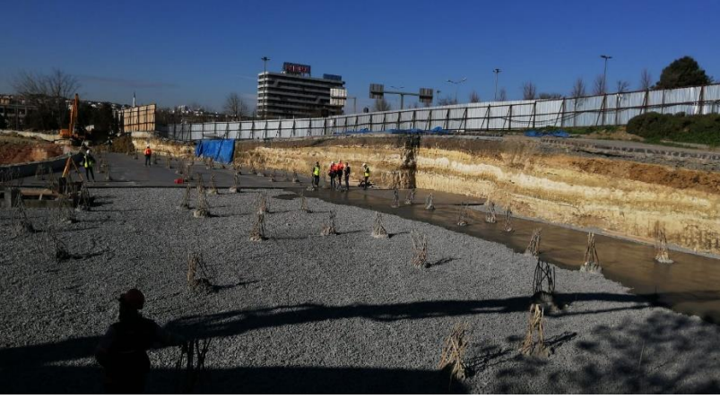
Ocak ayı grobeton dökümü