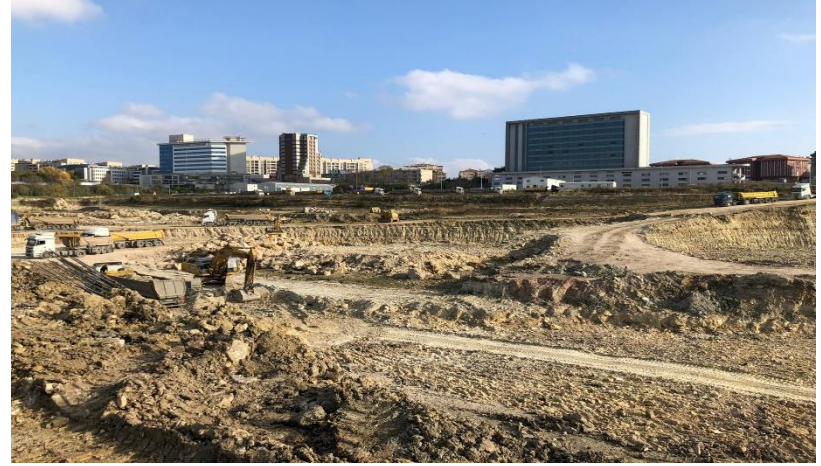
Kasım ayı genel durum – 2