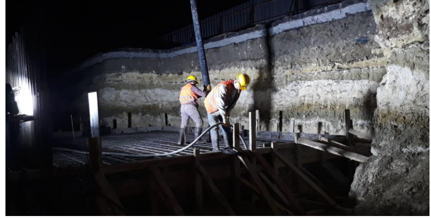
Ocak ayı kuleviñç temel betonu