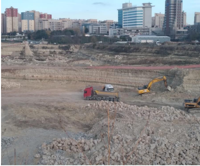
Ocak ayı genel durum