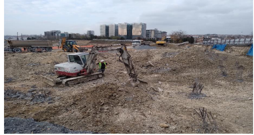
Aralık ayı genel durum