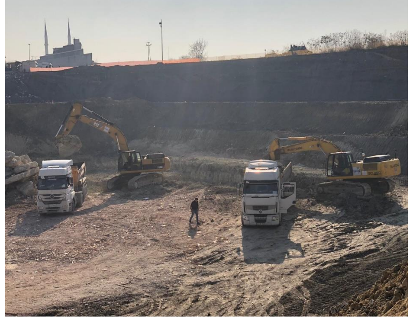
Ocak ayı genel durum – 2

NOT: Sahadan alınacak toplam hafriyat miktarı 1.730.000 m 3 tür. Bugüne kadar alınan miktar 978.500 m 3 (%56,5) olmuştur. Geriye kalan hafriyat miktarı 751.500 m 3 tür.