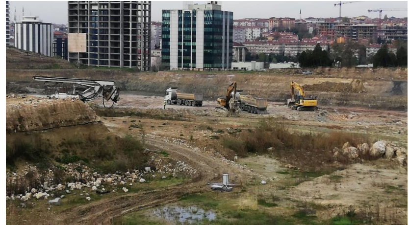
Aralık ayı genel durum – 2