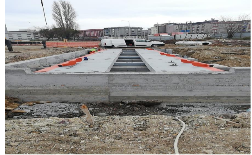
Ocak Ayı genel durum