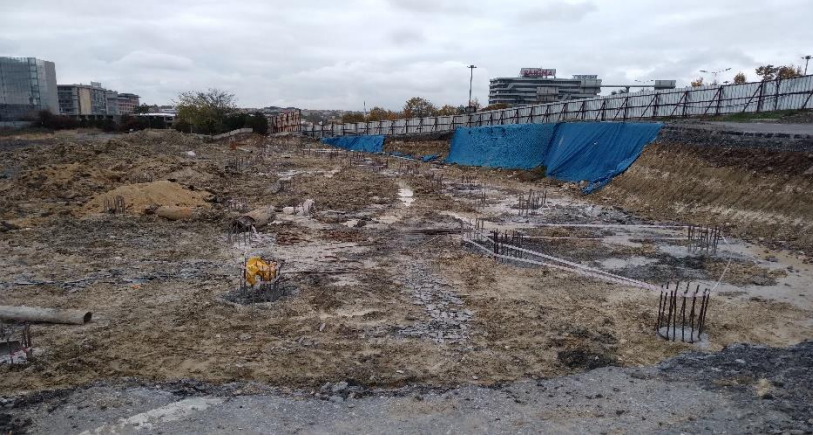
Kasım ayı genel durum