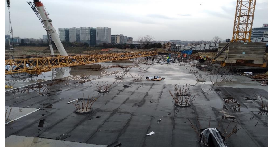
Ocak ayı son durum

NOT: Satış ofisi bölgesinde temel altı grobeton dökülmüş olup izolasyon işleri %70 oranında tamamlanmıştır. Temel kalıp imalatı devam etmekte ve mayıs ayı içerisinde tamamlanması öngörülmektedir.